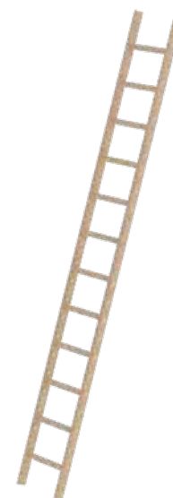
Abb. Bestell-Nr. 33112