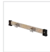
Nachrüst-Traverse Bestell-Nr. 30370