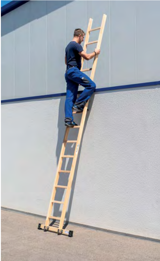
Abb. Bestell-Nr. 33116