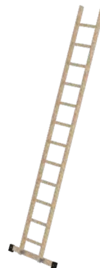
Abb. Bestell-Nr. 33115

mit rutschsicheren Leiterschuh (liegt ab Leiterlänge 3,0 m lose bei)